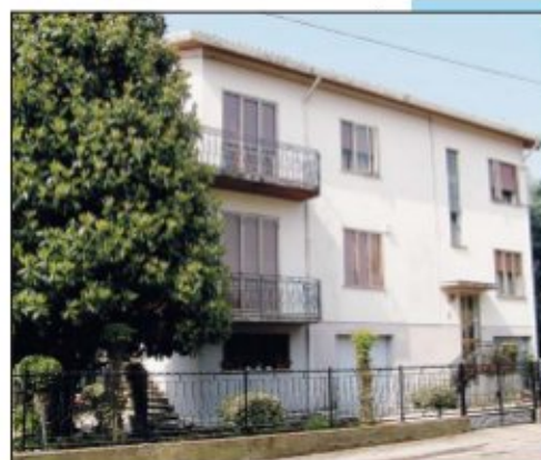
Il centro Maria Bolognesi, ultima casa della mistica